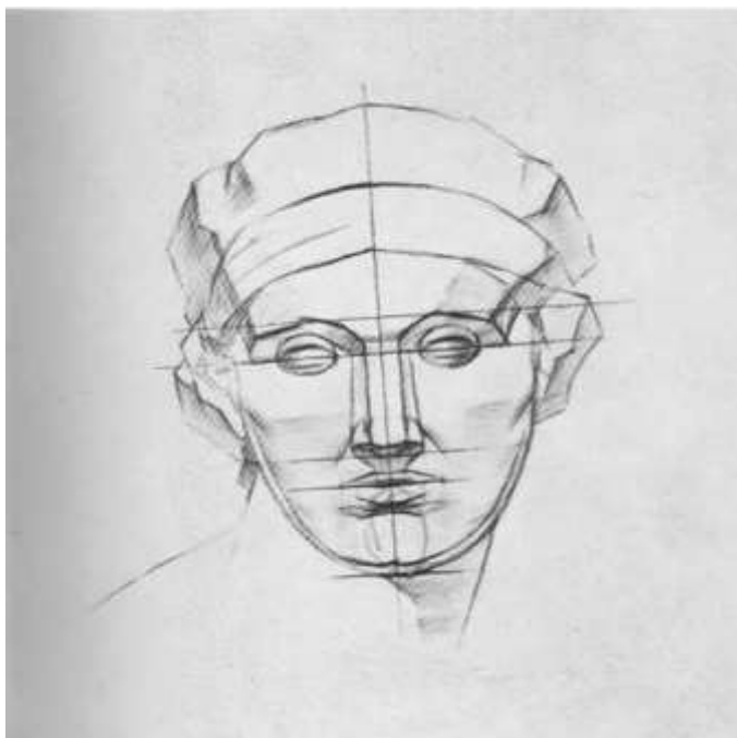
Рисунок 1. Классическая скульптура головы человека

Примечание: Оценка снижается, если линии выполнены с помощью 50 вспомогательных инструментов (линейка, край картона и др.)